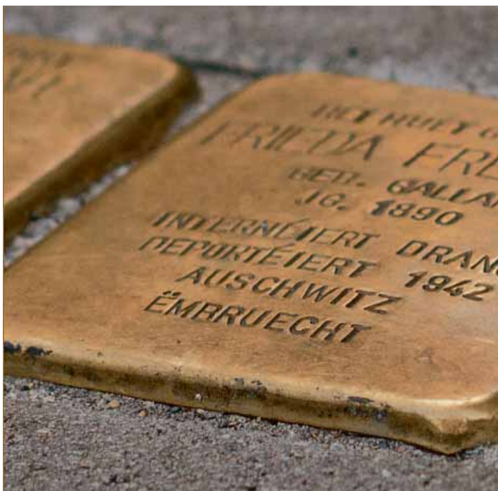
Am 24. Juni kommt es zur nächsten Verlegung der Stolpersteine, diesmal in Remich